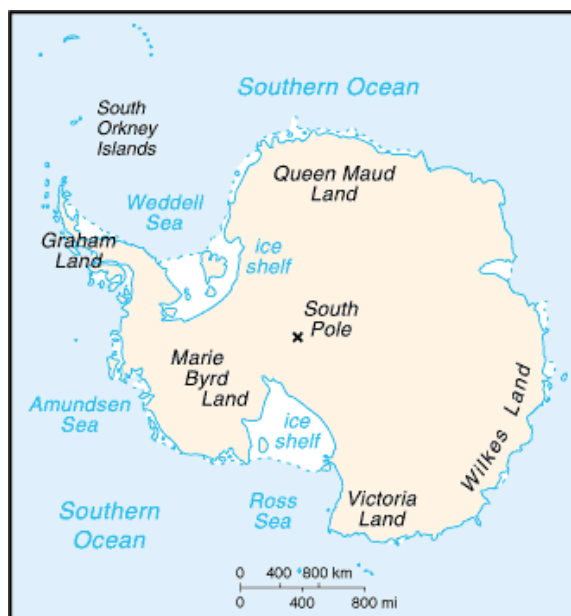
شکل ۱. موقعیت جغرافیایی منطقه جنوبگان شامل بخش سرزمینی، اقیانوس و دریاهای اطراف (۱).

سایر کشورهای ذی‌نفع در این زمینه پیشرو بوده و در کنار بررسی حقوقی و قوانین بین‌المللی مرتبط به حضور در این منطقه جغرافیایی با اهمیت، اقدام به رایزنی‌هایی علمی در سطح دانشگاهی و ملی نموده و تشکیل اتاق فکر پژوهشی جنوبگان را جزو اولویت‌های مطالعات پژوهشی فرامنطقه‌ای قرار دهد.